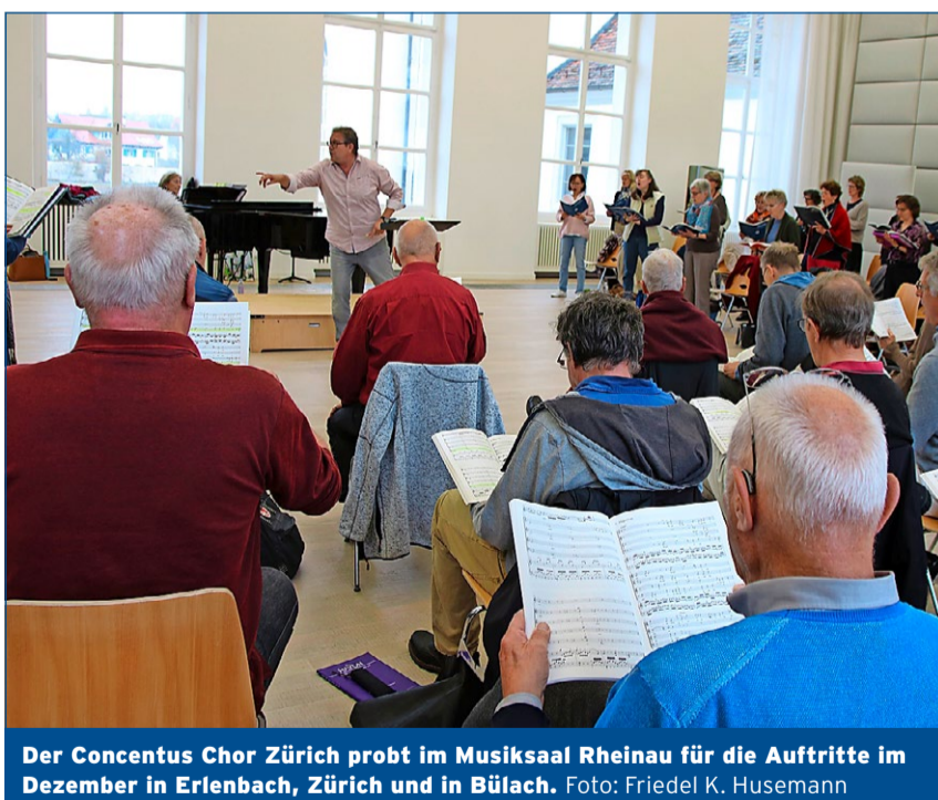
Der Concentus Chor Zürich probt im Musiksaal Rheinau für die Auftritte im Dezember in Erlenbach, Zürich und in Bülach.

Der Concentus Chor Zürich tritt im Dezember dreimal wieder auf: in Erlenbach, in Zürich und als Finale am 18. Dezember in der reformierten Kirche Bülach.