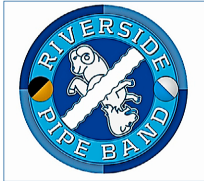
Das Logo gehört zu den Auftritten der Riverside Pipe Band.